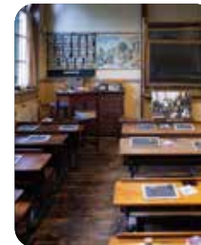
Museum Burghse Schoole

Hier wordt op unieke en vernieuwende wijze verteld over hetgeen op Schouwen-Duiveland gedurende de geschiedenis van belang is geweest voor de landbouw op het eiland.